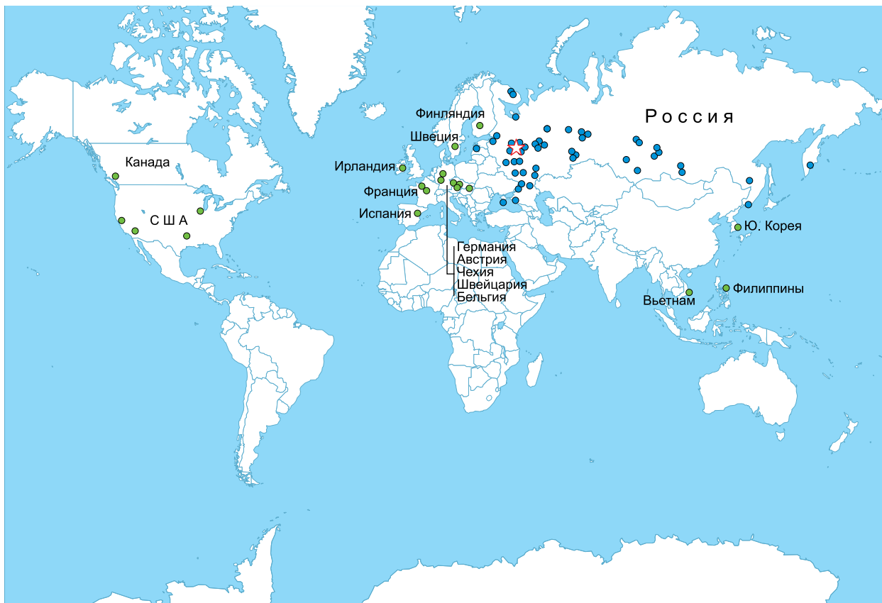
Рис. 1. География командировок сотрудников ИБРАЭ РАН

захоронение), что позволило глубоко и всесторонне изучить опыт других стран по обращению с РАО. Успешное сотрудничество продолжалось более 5 лет. В рамках него в 2009–2011 гг. были организованы семинары, на которых специалисты SKB-IC делились опытом Швеции и других стран в области захоронения РАО, включая сформировавшуюся систему финансирования захоронения РАО, подходы к анализу безопасности объектов захоронения РАО, принятую классификацию РАО для целей захоронения. Специалистам ИБРАЭ РАН и ряда организаций Госкорпорации «Росатом» удалось познакомиться с объектами шведской системы захоронения. Отметим, что в рамках международной деятельности Института, в том числе по направлениям, касающимся обращения с РАО, сотрудники смогли непосредственно на месте познакомиться с программами работ по обращению с РАО в основных странах, развивающих атомную энергетику (рис. 1).