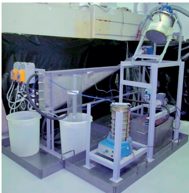
Рис. 2. Лабораторный стенд очистки РЗГ методом гидросепарации

разработан, изготовлен и испытан лабораторный стенд (рис. 2).